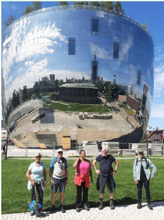
varende hot tub

Zondag 26 juli : BoTu, Bruggen-wandel-loop, start in wijk Feijenoord. Afstand 15 km. Meld je aan om startpunt te vernemen. Starttijd 11.00 uur.